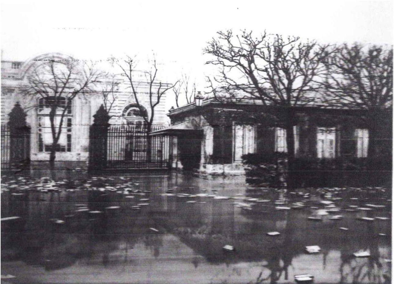
Ministère des affaires étrangères, crues de la Seine, 1910, 2018, huile sur verre, impression et peinture synthétique à la bombe sous verre, 118, x 157,5 cm