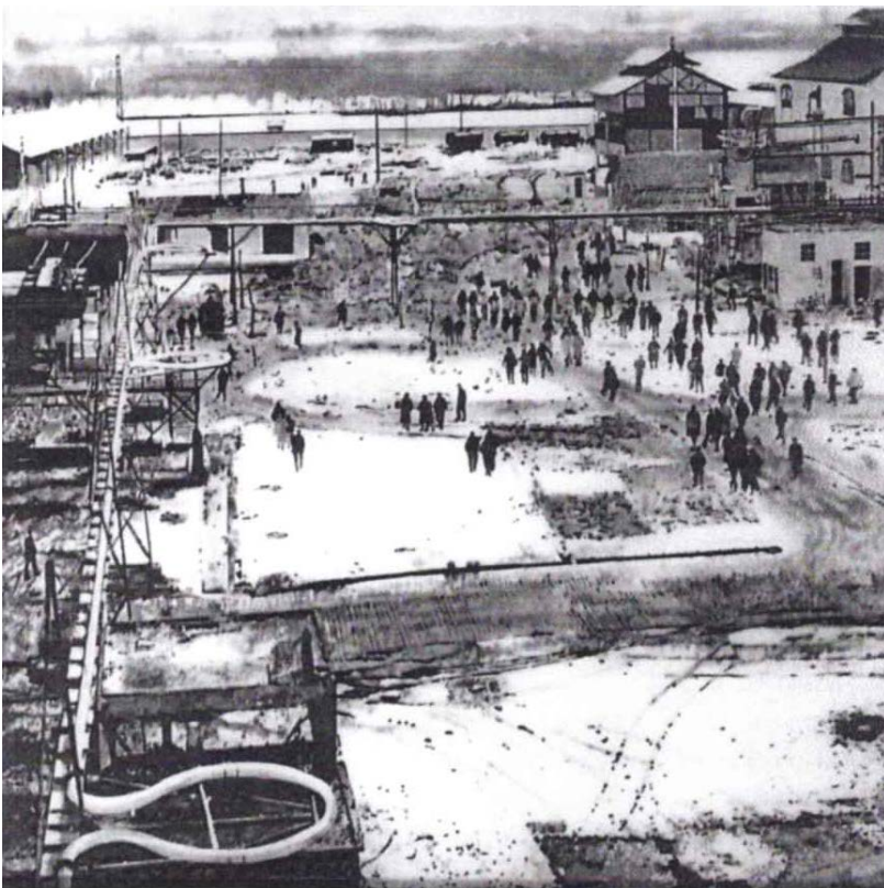
Sortie de l'usine Kem One de Saint-Fons, 2017, huile sur verre, peinture synthétique à la bombe sous verre, 138,5 x 99 cm