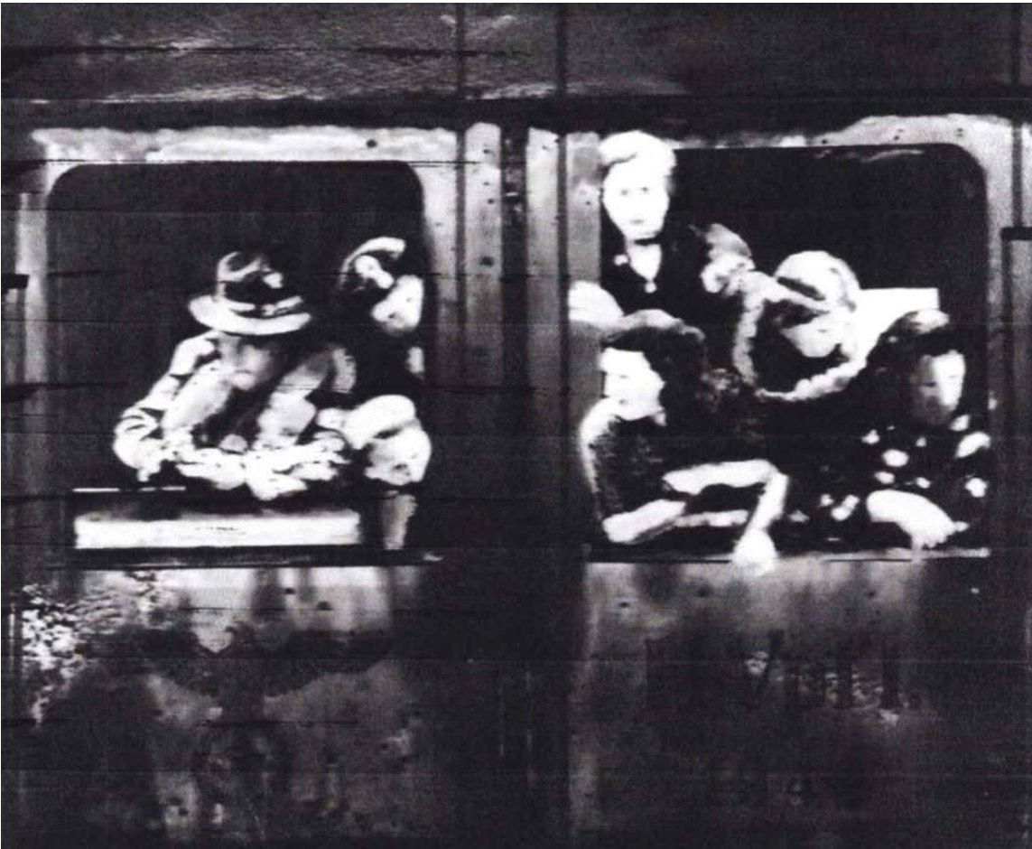
Déportation de sinti et roms, 2017, huile sur verre, sac de ravitaillement de la Heer IIIe Reich sous verre, 98 x 115,5 cm