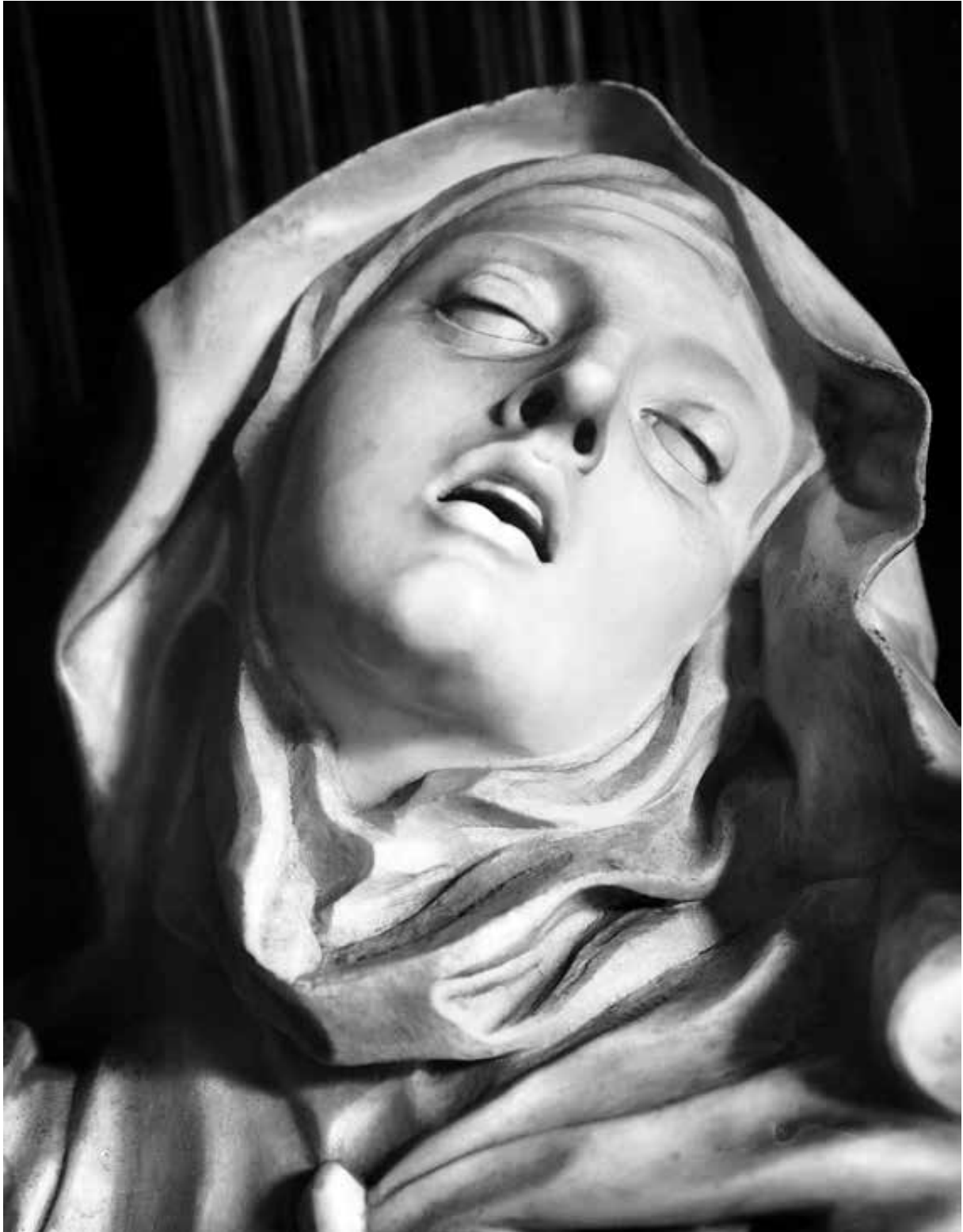
Le Bernin (1598-1680), Extase de sainte Thérèse (détail), église Santa Maria della Vittoria, Rome, 1645-1652, marbre.