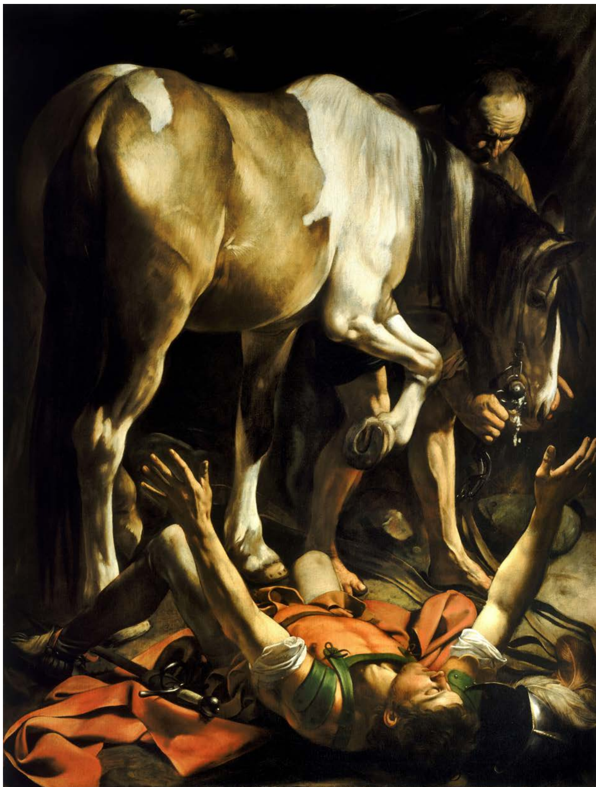
Le Caravage (circa 1571-1610), La Conversion de saint Paul , circa 1604, huile sur toile.