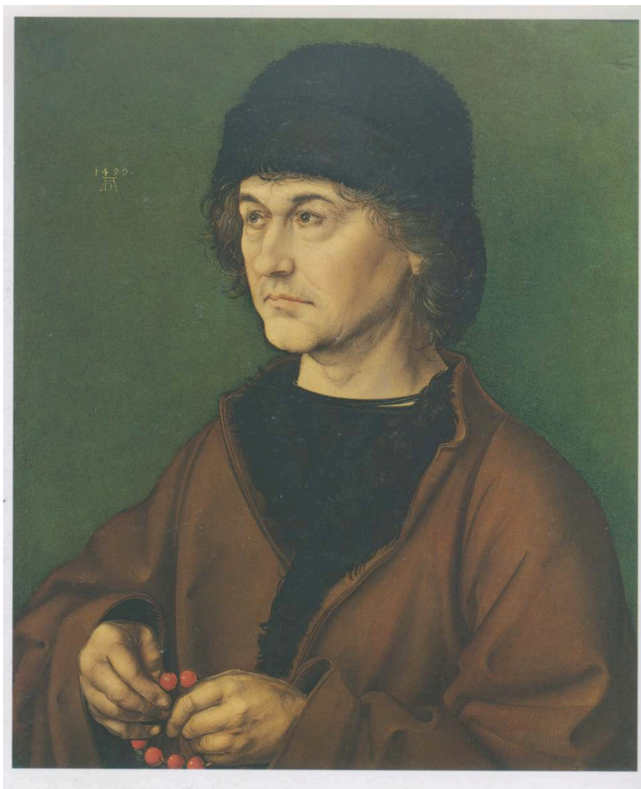
Albrecht Dürer (1471-1528), Portrait du père de l'artiste , 1490, huile sur bois.