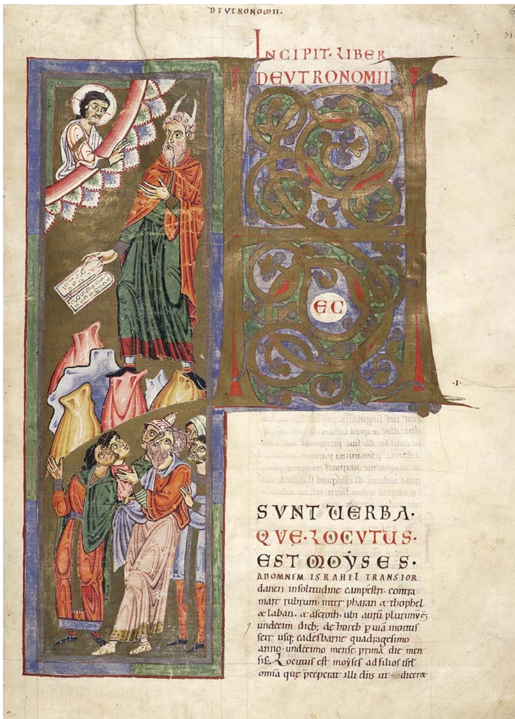
Moïse reçoit les Tables de la Loi, Bible géante d'Admont, circa 1140.