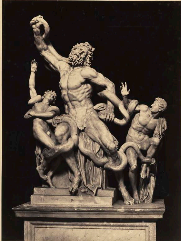
Laocoon et ses fils (avant la restauration de 1959), Rome, I er siècle av. J.-C., marbre, h. 2,13 m.