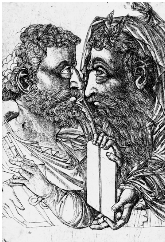
Jean Duvet, Moïse et saint Pierre , circa 1550, burin, 247 x 162 cm.