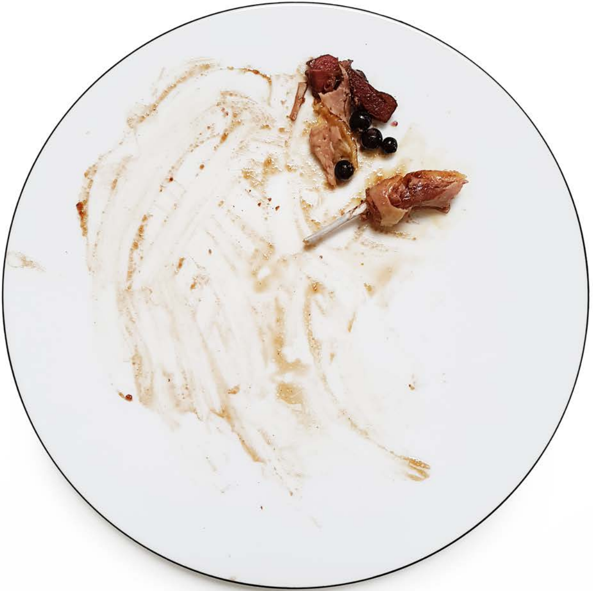
Pigeon aux baies de cassis