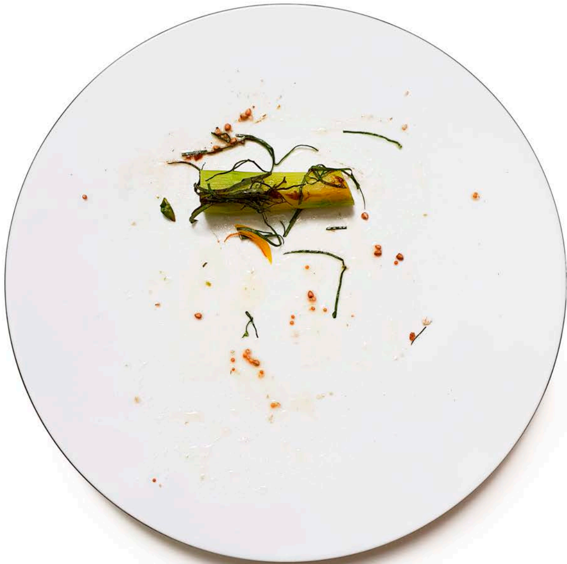
Asperges au blé noir