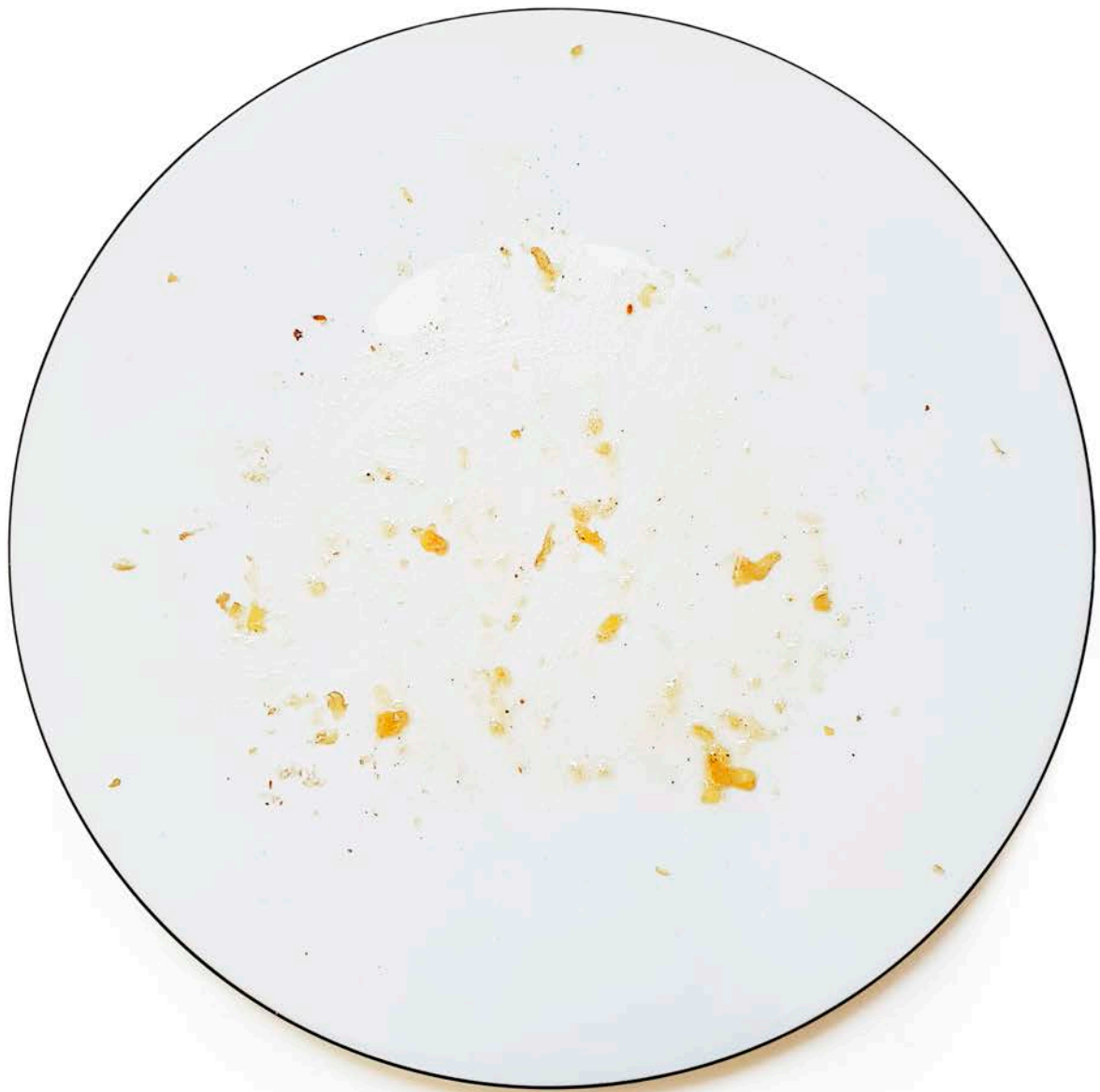
Miettes de châtaigne et miettes de truffe