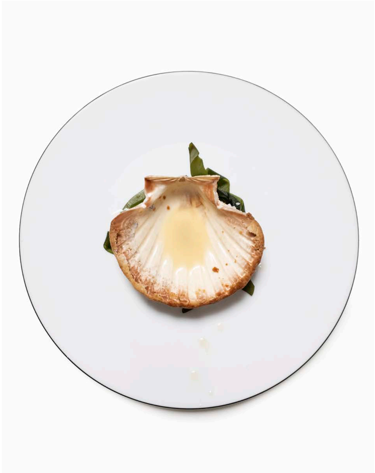
Saint-Jacques « Boulez »