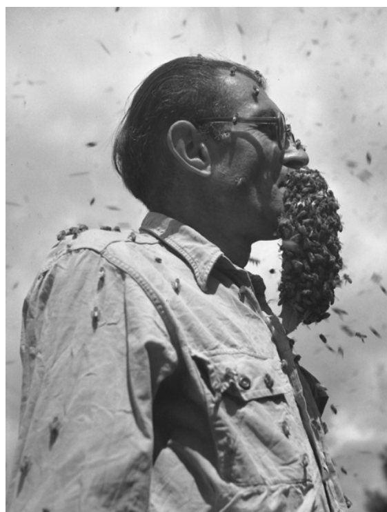
Illustration pour Miel