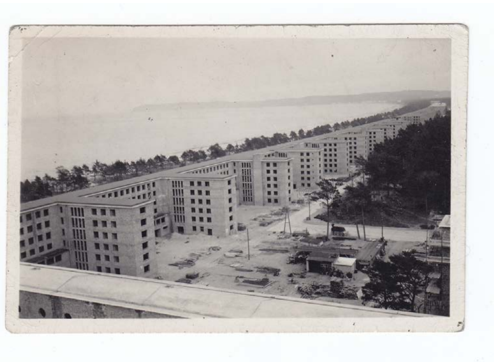
Illustration pour Rügen