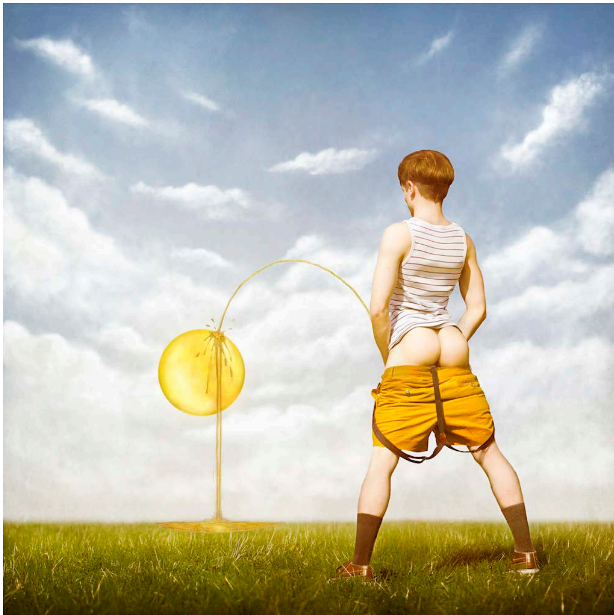
Marwane Pallas, Unload , 2013, photomontage.