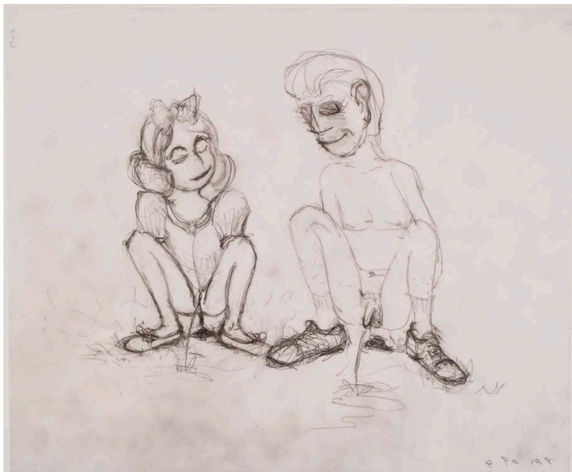
Paul McCarthy, In Nature , 2009, dessins pour White Snow Exhibition , Hauser & Wirth, NY.