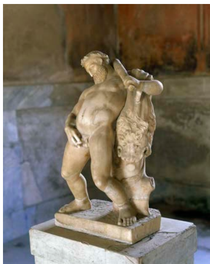
Florence, Maison des Cerfs (Herculanum), Hercule ivre en train d'uriner.