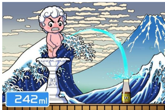
Sega, Toylet, jeu vidéo, 2011.