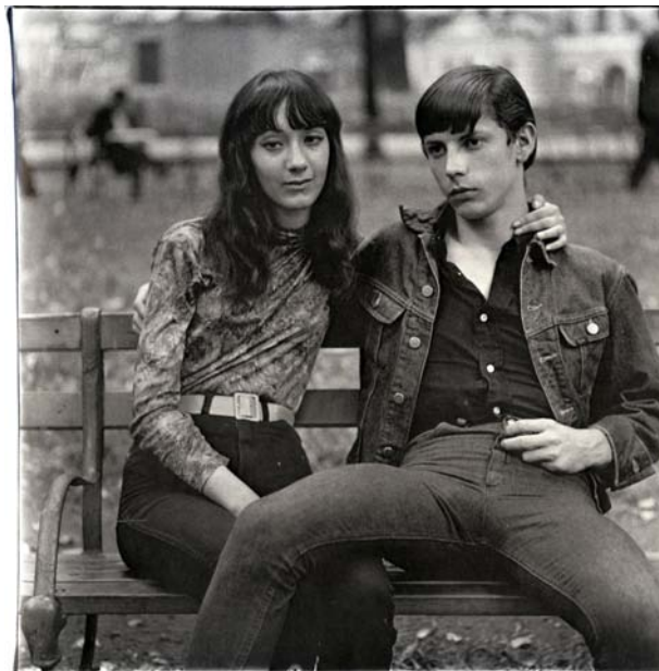
Diane Arbus, Young couple on a bench in Washington Square Park, New York, 1965 , photographie.